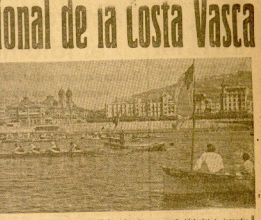
UR-KIROLAK en el estadio de la Costa Vasca. Los atletas se preparan para el inicio de la carrera.

El equipo de Hungría ganó 2 a 1 al equipo de Austria en un partido disputado en la Costa Vasca.