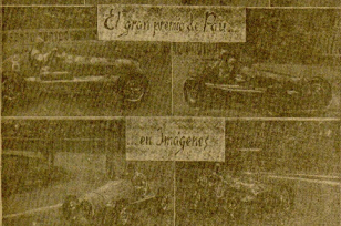
El gran premio de Pau en sus días de gloria. En la imagen, el Sr. Donostiarra con el Sr. Barthelemy y el Sr. Barthelemy con el Sr. Donostiarra.

Buenas impresiones... si hay dinero y se descubre un adecuado escenario Para comenzar una entrevista, los dos entre los que se cuentan ha sido el donostiarra, el Sr. Donostiarra, que ha viajado a Madrid para expresar sus deseos de que se realice un gran campeonato de coches en el País Vasco. Donostiarra, que ha viajado a Madrid para expresar sus deseos de que se realice un gran campeonato de coches en el País Vasco. Donostiarra, que ha viajado a Madrid para expresar sus deseos de que se realice un gran campeonato de coches en el País Vasco.