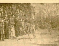
El momento del despiece de la VI Subida a Aránzazu, momento en el que los señores se retiraron a sus respectivos domicilios.

Una vez más, recordamos a los señores de la VI Subida a Aránzazu, que honra el magno acontecimiento deportivo de hoy. En la localidad de Oñate, en la parroquia del Concejo de Aránzazu, se celebró una gran fiesta deportiva, en la que participaron un gran número de señores. La fiesta terminó en el momento del despiece, y los señores se retiraron a sus respectivos domicilios. En Oñate, se celebró una gran fiesta deportiva, en la que participaron un gran número de señores. La fiesta terminó en el momento del despiece, y los señores se retiraron a sus respectivos domicilios.