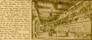
El estudio de la biblioteca del hotel que ocupa de 16000 volúmenes.