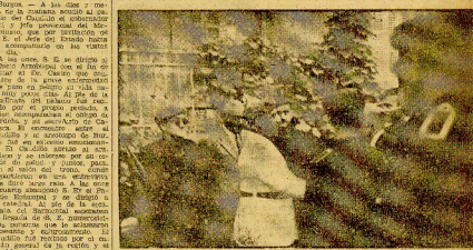
El Sr. Director General, Sr. Director de la Administración y Sr. Director de la Inspección de Hacienda.