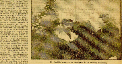
El Caudillo saluda a su Arrogancia en la Serenidad Femenina.