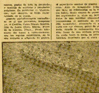
LA TRIPULACION OROBATRA

TALLERES DE PELETERIA J. CUESTAS La máxima garantía en calidad La más impecable confección Modelos y precios exclusivos