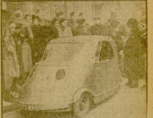
El nuevo modelo de auto eléctrico con el que se cuenta en el mundo...