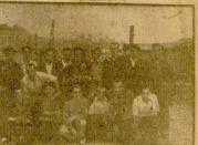
Los señores miembros del Jurado, para los que se celebró el sorteo de la regata de hoy.