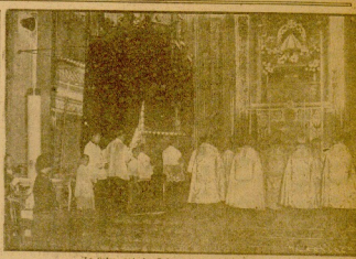
La Virgen sobre la Patrona de San Sebastián.