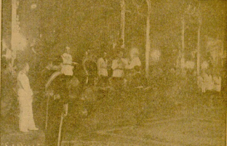
Madrid. En un salón del Palacio de Oriente, una Misión alemana, presidida por el embajador de Berlín, se reunen, después del día del Estado, las instancias de la Gestapo para discutir el problema de la Virgen del Coro.