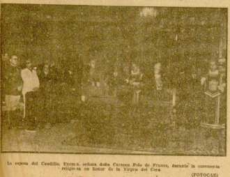
La esposa del Caudillo, Dña. de Arce de la Cuerva Pida de Franco, durante la ceremonia de proclamación de la Virgen del Coro.