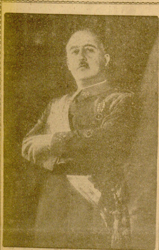
Francisco Franco, Generalísimo y Artífice de la España actual, rinda hoy pleitesía a la Excelentísima Madre de Dios.

Tara que su protección descendiera sobre nosotros y haga fecundo en la paz el triunfo otorgado en la guerra.