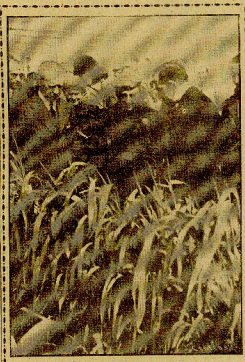
En un momento de su estancia en la biblioteca del Guadalquivir, con el ministro de Obras Públicas, el director general de Colonias Penales, coronel don José Párraga, y otros personalidades.

La esposa del Caudillo y su hija estuvieron orando en Carmona ante la Virgen de Gijón... Del ministro de Industria visitó la fábrica de aviones