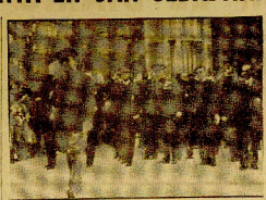
La gran procesion de Javes Surto, en la representacion de S. P. de San Sebastian...