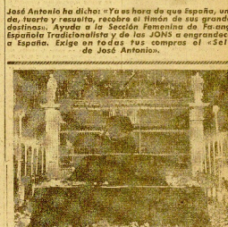
Alzola. -- La comitiva al momento de su llegada a Alzola, tras haber estado en el pueblo de San Sebastián.