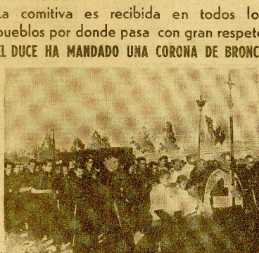
Alzola. -- El Alzola con multitudinaria presencia de José Antonio y su entourage en marcha hacia Alzola