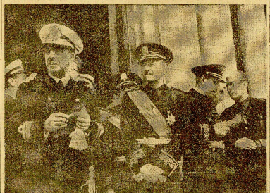
Los ministros de Justicia, Educación y Sanidad. En el centro, al salir del Palacio de la Dársena, la ceremonia de presentación de Catras Credenciales del embajador de Italia.