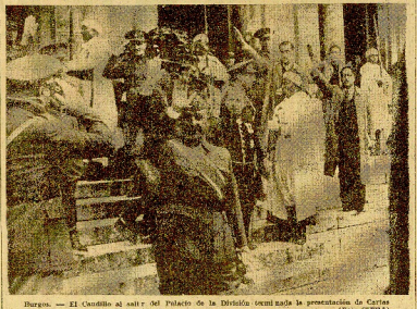
Burgos. — El Centro al salir del Palacio de la Dársena (señala la presentación de Catras Credenciales de Italia).