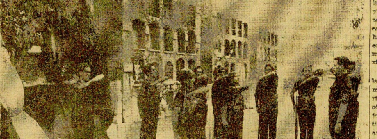
La tumba de José Antonio Primo de Rivera en el cementerio de Alicante.

El próximo Congreso mundial del descanso obrero se celebrará en Madrid. El congreso será organizado por el movimiento obrero internacional.