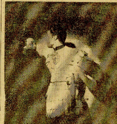
El momento del Teatro Nacional de Falange que el viernes representará en el "Plaza de San Toms" del "Hospital de los Reyes".