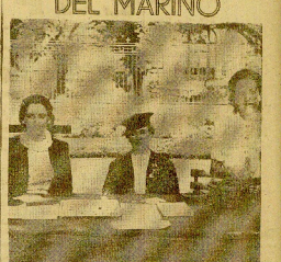
La fiesta del libro del marino...