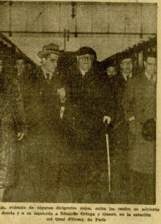
Mijaio, príncipe de algunos ducados, en su residencia vaticana.

«MADRID»—El general Aranda visitó la residencia vaticana de Mijaio, en el Vaticano, el día 22 de abril.