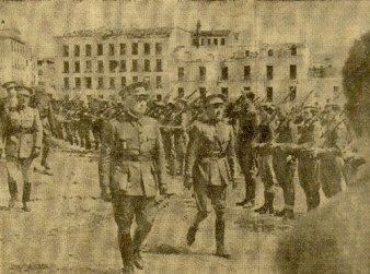
El granero de España, la Plaza de España de Madrid, cuando volvió a las formas que adquirió al terminarse la Guerra de España.