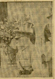
El mariscal Goring, en el momento de su llegada a Tripoli.