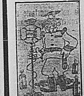
Atención! Retiros verídicos, auténticos y "falsos"... Hoy hemos tomado Jerez, Málaga, Montilla y Valdepeñas. Malaga, por la mañana, el día siguiente tomaremos Cádiz.