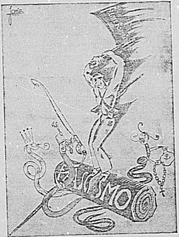
No está lejos las elecciones de las que salió victorioso el pueblo. Sus seguidores no encajarán la derrota y quieren imponerse por las armas. Quieren hacer bueno el cartel lanzado por las derechas para aplastar al comunismo y al nacionalismo. Pero han variado las cosas y los vasos, todos sin distinción, salidos de todos los rincones y todas las montañas, han empujado el hacha que aplastará al inhumano tronco del fascismo opresor.

como objetivo de su acción los terrenos del aeródromo, pero no así. Los aviones enemigos, acreditando sus pilotos, una vez más, sus bajos sentimientos, arrojaron una docena de bombas, todas ellas sobre la población civil. Los explosivos hicieron destrozos en algunas casas, sin mayor importancia,afortunadamente, y alcanzaron a un vecino, que resultó herido por la metralla en un tobillo. Después de curado fué trasladado a San Sebastián, temiendo que, por la importancia de la herida, se haya necesario amputarle la pierna. En una de las zonas alcanzadas por las bombas la metralla mató dos jamones que en la misma había.