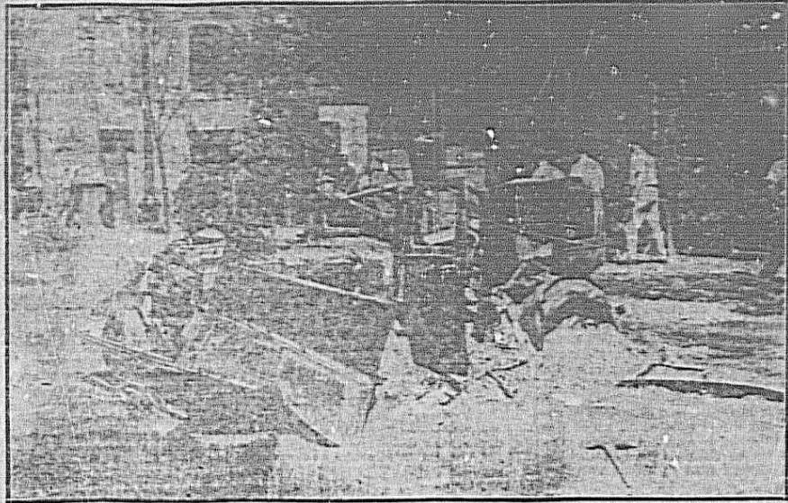
Una bomba de los aviones piratas cayó en la plaza del Ayuntamiento, donde se guardaban muchas mujeres y niños. Por fortuna, sólo hubo que lamentar un herido, ligeramente, aparte de haber quedado destruido el automóvil que presenta la fotografía.