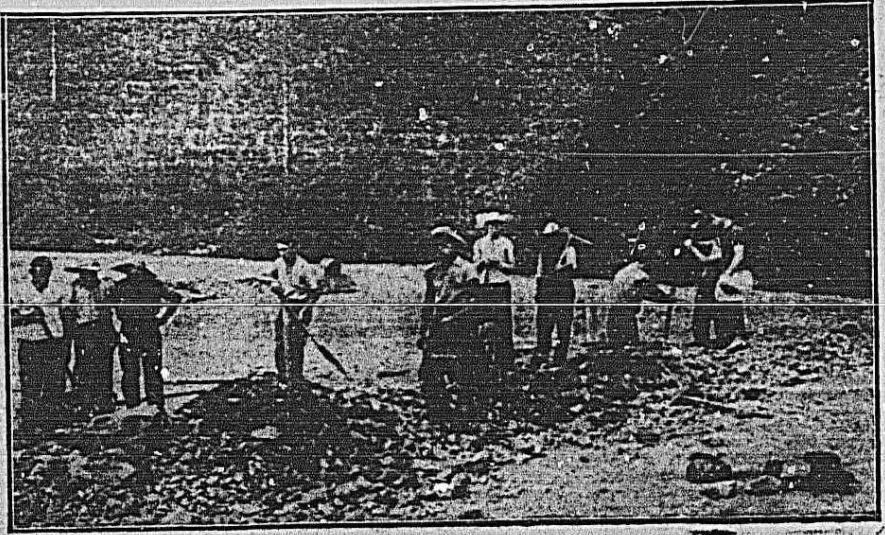
En el frente no solamente manejan las armas los bravos combatientes. Alcanzan el uso del fusil con el niño y la pala en fortificaciones que han de ser impregnables para el enemigo.