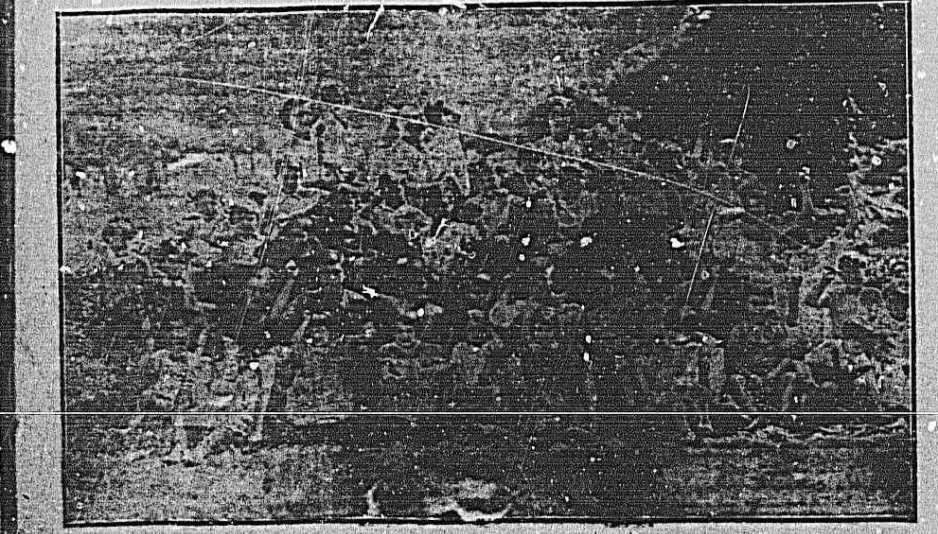
Hijos de proletarios, hijos de luchadores del pueblo, los niños acogidos en el Comité Pro-Infancia obrera...

«¿Cuántos trabajadores, cuántos hombres de inquietud, mandará asesinar ese mismo día el catolicismo traidor?»