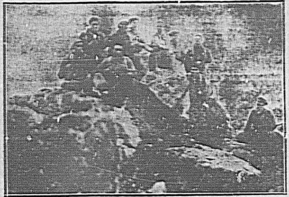
Un grupo de defensores de la República, corren un picacho desde el que hostilian a las partidas facciosas.

Euzko Indarra no tiene miedo, no tiene miedo, no tiene miedo; Euzko Indarra no tiene miedo, no tiene miedo al invasor.