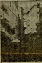
Por las calles empinadas de Fraga, cruzan los soldados de Franco.

Salamanca, 31 de Marzo de 1938 11 Años Triunfal.