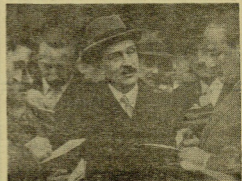
El ex presidente Blum, a su salida del Eliseo, después de presentar la dimisión.

(VEA NUESTRA INFORMACION EN PAGINAS INTERIORES)