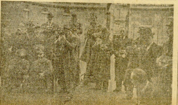
En el patio del Ejército, un verdadero ejército de fotógrafos permanece atento a las entradas y salidas de los personajes que acceden a entrevistarse con el presidente Leizaola en las horas sagradas de la transaccional crisis francesa.

San Sebastián Enero de 1930 — El Alto Tribunal.