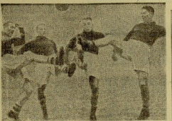
El otro día ofreciéndonos a nosotros, he aquí una fotografía de cuatro caballos de carrera dando a un tiempo el salto a un vallito. Hoy, en cambio, son cuatro jugadores dando la patada al mismo tiempo.