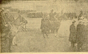
Detalle de los alumnos de la Escuela de Saint-Cyr, en el acto de la presentación de la bandera a la nueva promoción. En el centro, el general Lacas, comandante de la Escuela.

— Londres. — Los medios japoneses han informado que se han informado al Imperio japonés, que se ha de celebrar el Guin Internacional de Tokio.