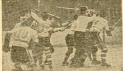
En un partido de hockey sobre hielo, disputado en el Madison Square Garden de Nueva York, los jugadores finlandeses...