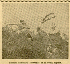
Soldados marchando en el frente aragonés.

Nadie que no haya un solo balcón sin estandarte al Euzkadiño. En la fiesta de mañana tiene que estar presente todo el pueblo. Nadie puede permanecer en su casa. Cada cual deberá ocupar su puesto. Las Brigadas de Navarra, con su heroicidad y su sangre generosa libertaron a San Sebastián de las garras rojas. Que la ciudad sea agradecida a sus salvadores. Las invitaciones para asistir a los actos de mañana, miércoles, pueden recogerse en la Asamblea de Euzkadi, número 1 (Guardia Civil).