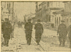
En los últimos días de la dominación roja, en Gijón, los mineros abandonan precipitadamente la ciudad y los guardias de Asalto patrullan por las calles.