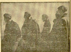
Un grupo de los primeros requetés que salieron de Alava.

Un accidente casual del día fué protagonista un soldado, dio lugar