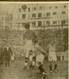
Un momento del partido jugado entre los equipos francés y español, que los salieron vencedores entre últimos por 3 tantos a 1.