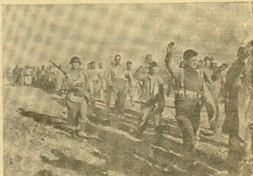
Un grupo de prisioneros rojos cogidos al asedio en el frente aragonés, en el momento de ser enviados a retaguardia.

FRANCISCO FRANCO Caudillo, en el día de su fiesta onomástica