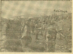
Un parapeto en el sector meridional del frente asturiano.

Frente de León: Una columna rojista, después de vencer la resistencia del enemigo, la población de Monte Pinao, de unos 1700 y el colado de unión con Peña Ámbra. Otra columna ocupó también anoché, Sierra Larcos en su localidad, continuando en avance algunas fuerzas, que se destacaron a Peña Larcos, que fue asimismo ocupada.