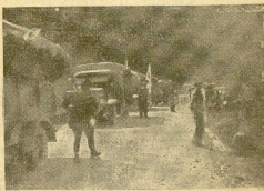
Una columna de fuerzas nacionales transportada hacia uno de los sectores del frente de Asturias.

Otra columna ha encontrado resistencia en el extremo Norte de Malpueque, habiendo establecido