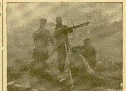
Una avistación aérea del sector de Asturias.

San Sebastián, 27 de Septiembre de 1937. — Segundo Año Triunfal. De O. de S. E. el General Jefe de F. E. T. y de las J. O. N. S. FRANCISCO FRANCO.