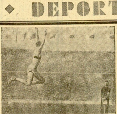
El saltador alemán Loeg, el más calificado rival del campeón mundial Eric Owens, realizando a un lanceable shot de 7 m. 10 cent.