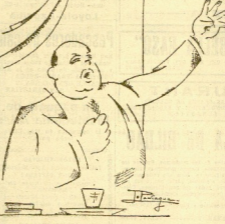
Printo, en su famoso discurso del Ateneo, played de mentiras y brutalidades.

Mayor dicho, detalladamente a un profesor de Salamanca de sorpresa, sobre todo al los condráramos en aquel tiempo; pero en cualquier otro mediante escribir de no perdida cordura, serían inabordable aquella proca literaria al servicio de la revolución. Un punto, seguramente así durre cuesta—de la genitalidad a la tontería hay un paso y un límite difícil de precisar, se convirtió en banderón de engaño y se creyó, de buena cuenta, un privilegio. Aunque más tarde, por paradójica manía, quiso presentarse como perseguido. La revolución movió agitadores que se filtraron en la Universidad para actuar como auténticos cultivos. Estos cultivados, tipo comel, cumplieron a satisfacción su cometido, hubieron convertirse en víctimas y levantar banderas de