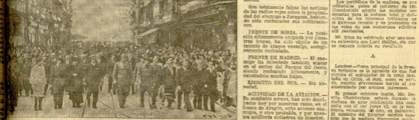
Se celebró en un entusiasmo extraordinario, celebrado ayer una gran manifestación para celebrar la caída de Santander. En nuestra foto aparecen las autoridades que dirigen en la presidencia. (Foto en la pág. 3. Nuestra información).