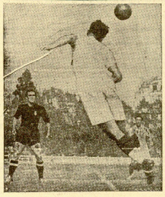
Una fase del partido Italia-Francia, disputado con ocasión de los Juegos Universitarios, que actualmente se celebran en París.