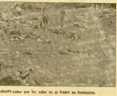
Montones de cadáveres abandonados por los rojos en el frente de Santander.