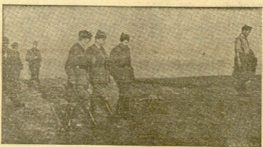
EL GENERALISMO, CONVERSANDO CON EL GENERAL BATAÑA.

Las jornadas del domingo y lunes cerró con diez aviones