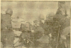
Un parapeto es el que, hasta hace poco, fué nuestro frente de Santander.

La Constructora Naval estará pronto en condiciones de prestar servicio a nuestra causa