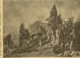
DESTRUCCION DE LAS NAVES

Poco más de dos años duró la colosal empresa, tan errada de dificultades, que hizo que el mundo se estremiera por la existencia de hechos e informas documentadas por los españoles. Llegó a ser un mundo nuevo, fértil imaginación, leyenda urdida por las mentes. Cosa es, sin embargo, rico y vivaz. Y el mundo se estremió cuando se conoció el brillo los hechos españoles y los sucesos de España. Porque un puñado de hombres nuevos, frente a una cultura tan antigua y desconocida, frente a un poderoso imperio rico y valiente, frente a las dimensiones y a las riquezas de un mundo desconocido, dominó el gran imperio azteca. Y se destruyó con sus naves — cuando un millar de los españoles se enfrentaron a los aztecos, que eran quince mil — el ánimo de los aztecos, tras una emboscada para los españoles, que por el momento se retiraron. La expedición y tema de México fue obra de España, para llenar de asombro a los europeos.