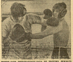
TOMMY FARR, ENTRENÁNDOSE PARA SU PROXIMO COMBATE CON LOS LOUIS

En 1948 ganó el Gran Premio de Alemania, resultó vencedor en las competiciones de resistencia con rapidez y se creó con fuerza para participar en Sudáfrica.