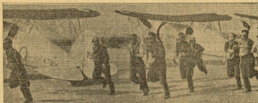
En Inglaterra tienen lugar actualmente grandes maniobras militares en las que intervienen todas las armas del Ejército. En la foto que se reproduce aparecen los soldados de la 4.ª Brigada, dispuestos a repeler una supuesta agresión de los aliados enemigos que han lanzado ya algunas bombas de gas. Asimismo, para paralizar la acción de esos adversarios.

(VEA NUESTRA INFORMACION EN LA PAGINA SESTA)