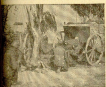
Una batería nacional en el frente de Teruel.

CRONICA DEL CORRESPONSAL DE LA AGENCIA FARO