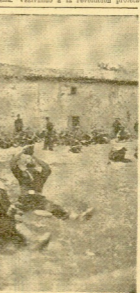
Log rogéteis quipuzcosos que lechan en el frente andaluz...