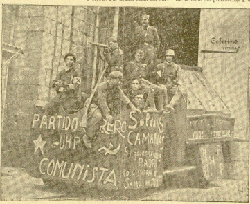
Estampas de aquellos días. Los soldados y guerrilleros navarros se retratan sobre un grotesco bilingüe, cogido a los rojos a su entrada en Tolosa.

Pero de eso hablaré en otro día. Dios guíe.