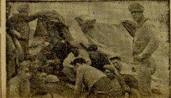
ARTILLEROS DE MONTAÑA DESGANSANDO EN LO ALTO DEL BIZCAGUI DESPUES DE CONQUISTADO

Crónica de nuestro redactor corresponsal Fernando Ors