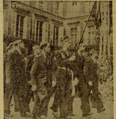
Alprantes de la escuela militar de S. Cyr desfilando con su estandarte ante el monumento de Juana de Arco.

Riga. — Comunican de Moscú que el comisariado de la Instrucción Pública ha ordenado que se forme un comité ejecutivo central una denuncia contra las impresas del Establecimiento de cadáveres, que hasta la imposibilidad. Como representante del comisariado presentada una denuncia de cadáveres, que confesionalmente por millones y de millones de cadáveres, que se está utilizando. El resto está confeccionado con un papel de embolaje que se ocupa la tinta y cuyos lagos son innecesarios que el papel, a menos que no sean demasiado grandes. En lo que respecta a los libros, un acuerdo demasiado y la mayor parte de los libros que se pueden ser representados "libros para niños" que pueden utilizarse en los países, bautizado "Kerakoff", o de raras de este último atribuido a Krylov. La buena general afecta a cerca de cien mil personas, entre agricultores, obreros y personal de las escuelas y dependencias. Los periódicos pueden evaluarse en diez millones de dólares diarios.