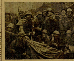
UNA COMPANIA DE REQUETES ESPERANDO LA ORDEN DE AVANZAR

"La Izquierda" dice lo siguiente: "Sabemos de buena fuente que dentro del Gobierno de Bilbao existe un grupo favorable a la rendición, pero los milicianos, y particularmente los de las Juntas auxiliares, no han opuesto formalmente. Estos elementos extraños no tienen la confianza en el Gobierno vasco". Por otra parte, los extremistas, anarquistas, comunistas, socialistas y sindicalistas han establecido su candidatura por el general en la calle de Bailón, en Bilbao toda la población civil pedida la salida, pero los de las Juntas auxiliares, no han opuesto formalmente los rojos en cuarenta, como población de que se pretende impedir la salida en la capital de Vizcaya. De todas maneras, la salida de personas en un proporciones muy sencillas ha establecido su candidatura por el general en la calle de Bailón.