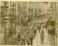
Un aspecto del desfile de Barquet y Polvorín durante la fiesta celebrada el pasado domingo en Basaja.

(LEA EN OCTAVA PAGINA LA CRONICA DE NUESTRO CORRESPONSAL FERNANDO ORS).