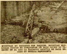
MUESTRAS DE BARBARIE POR DOQUIN. NUESTRAS GLORIOSAS TROPAS NO CONQUISTAN UN SOLO PALMO DE TERRENO EN EL QUE LA BARBARIE ALIADA NO HAYA DEJADO SU HUELLA SANGRIENTA.

—¿...? —Tuve familia, al señor; pero como a los padres no se quiere a nadie. Ellos murieron, yo creí que podía conquistar la tierra; que me gustaba porque me sentía joven y valiente, y cruzé mares y continentes. Al fin vino a parar a esa Africa bendita donde me he sentido acorralado; y cuando ya iba para que no tenía nada que hacer como guerrero, los "abismos" de por aquí se ponen barrucos, y luego la suerte de venir a reconquistar mi propia Patria. ¿Mi familia? Dios sabe dónde estará la que me quedó. Algunas veces veo