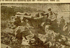
SUS MILICIANOS ROJOS. SI PERO, AUNQUE LO PAREZCA, NO SE ESTAN JUGANDO LA VIDA SE TRATA, SIMPLEMENTE DE UNOS EJERCICIOS DE INSTRUMENTACIÓN DEL EJERCITO POPULAR DE CATALUÑA

Aquel sujeto pasó a las líneas de la retaguardia inmediatamente, mientras el empuje nacional seguía su acometida hasta el límite que se le había impuesto. Los marxistas retrocedieron hasta las líneas que nosotros hoy ordenamos, y los legionarios volvieron a las posiciones donde la victoria podía ducir una cierta garantía. Aquel prisionero fué luego objeto de la curiosidad de todos, por su aspecto, tanto como por las extrañas condiciones en que había sido. E interrogado, contó así: