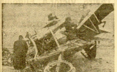
RESTOS DE UN AVION ROJO DERIBADO POR NUESTROS CAÑONES ANTI-AEROS DE TERUEL

Salamanca. — En el frente de Asturias las tropas nacionales han continuado su melódico avance, ocupando mucho más territorio del que tenía antes de iniciarse la última ofensiva roja, que, como ya se sabe, terminó con terribles consecuencias para sus tropas.