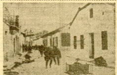
NUESTRAS TROPAS OCUPANDO UN PUEBLO DE SUALAXARÁ. DURANTE SU VICTORIOSO AVANCE POR AQUEL SECTOR AL-CARRERO

A nosotros nos hubiera gustado ver la cara que ponían los comerciantes catalanes, que, en gran mayoría, votaron las candidaturas del Frente Popular, al oír la "crisis" gerencial del leucor comunista, aunque ya sabemos que, ahora, se llaman ya fascistas, porque sus antecedentes amigos les están dejando atrás, cuando no sea pelaje. Y los "idéales", son agite todo. ¡No faltaba más!