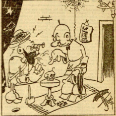
—¿Quié todos estos ‘hermanos’?... ¿Qué?... —‘Bueno, así en confusión... ya habrá algún primo, verdad’