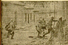
UNA PATRULLA DE SOLDADOS NACIONALES, DURANTE LA OCUPACION DE UNO DE LOS PUEBLOS DEL SECTOR DE GUADALAJARA

LEA LA CRÓNICA DE NUESTRO CORRESPONSAL FERNANDO ORS EN LA PAGINA OCTAVA.