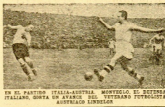
EN EL PARTIDO ITALIA-AUSTRIA. MONVELO EL DEFENSA ITALIANO, OHTA UN AVANCE DEL VETERANO FUTBOLISTA AUSTRIACO LINZELER

Y UN EGUARAS TERCER PARTIDO A REMONTE Solaverri y Zumeta contra Izaguirre (P) y Bengochea