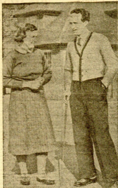
EL REY DE BELGICA LEOPOLDO III, DURANTE SU RECIENTE ESTANCIA EN LONDRES, JUEGO UNA PARTIDA DE GOLF CON MISS PAUL HARTON, CAMPEONA INGLESA DE ESTE DEPORTE

... Casi todos los boques llevan voluntarios, haciéndolos pasar por tripulantes o pasajeros. Muchos de ellos son voluntarios que se han comprometido a no tomar parte en las acciones bélicas.