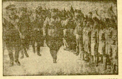
DURANTE EL VIAJE TRIUNFAL QUE EL DUCE HA EFECTUADO A LIBIA, HA SIDO ACLAMADO FRENÉTICAMENTE POR NUMEROSAS ORGANIZACIONES DE LOS "BAIJJAS" INDIGENAS

LA CONSOLIDACION NACIONAL DE POLONIA Varsovia. — El duque gubernamental de "la consolidación nacional" de Polonia, ha comunicado las masas de todas las organizaciones y el pueblo en general. Sin embargo la reunión del día del 17 de febrero, lo que está creando muchísimo interés.