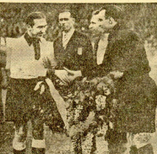
Los capitanes de los equipos de fútbol, representantes de Alemania y Francia, cambiando los ramos de flores y los aplausos de rigor antes de comenzar el encuentro que terminó con la derrota de los franceses por cuatro tantos a cero.