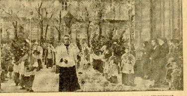
ANTEAYER, DOMINGO DE RAMOS, SE CELEBRARON EN NUESTRA CAPITAL LAS CEREMONIAS PROPIAS DE LA FESTIVIDAD DE ABRIL LA SEMANA SANTA...