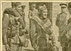
EL HEROICO GENERAL VARELA CONVERSANDO FRATERNALMENTE CON UNOS SOLDADOS, MOMENTOS ANTES DE INICIARSE LAS BRILLANTES OPERACIONES QUE SE ESTAN DESARROLLANDO EN EL SECTOR DE SIGÜENZA.